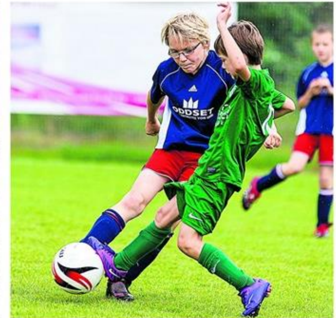
Drei Tage lang bestimmt der 2. Werner-Heinke-Cup das Geschehen beim Veranstalter VfL Bückeburg.

E-Junioren des VfL Bückeburg sicherten sich den Turniersieg durch ein 1:0 im Finale gegen den TSV Westerhausen-Föckinghausen. Dritter wurde der TSV Stelingen mit einem 3:0-Sieg über die JSG NWB KIHO.