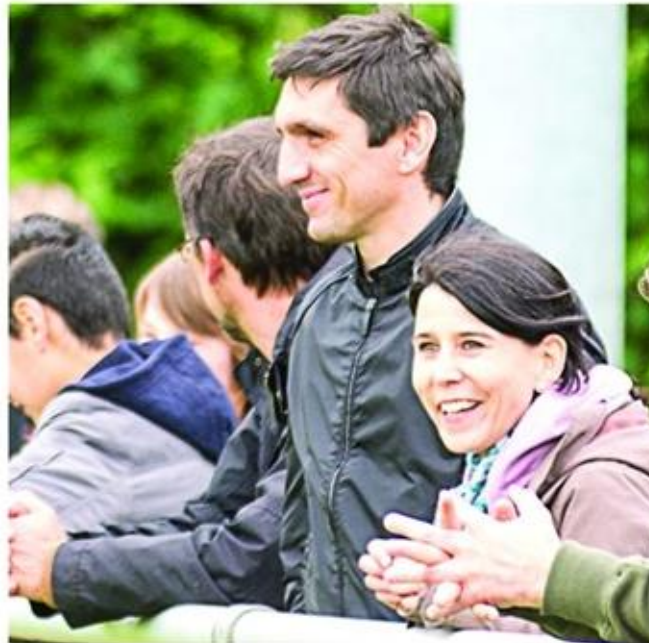
Hannover 96-Trainer Tayfun Korkut beobachtet interessiert den eigenen Nachwuchs.

Das Turnier der G-Junioren entschied die JSG BHK Kalletal durch einen 3:0-Finalsieg über die JSG Süd Weser III für sich. Auf Platz drei kam der VfL Bad Nenndorf nach einem 3:2 über