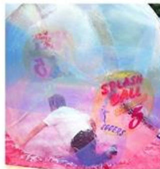
Auf der „Splash Ball“-Anlage haben vor allem junge Besucher ihren Spaß. mm

„Splash Ball“-Anlage. In etwa zwei Meter großen Wasserbällen konnten die Kleinen in einem Schwimmbecken über das Wasser rollen, ohne nass zu werden. In der Kugel aus durchsichtiger Folie musste man versuchen, sich möglichst gleichmäßig zu bewegen, um vorwärts zu kommen, ohne hinzufallen, was aber schnell doch passieren konnte und auch vielen Spaß bereitete. Kinder-